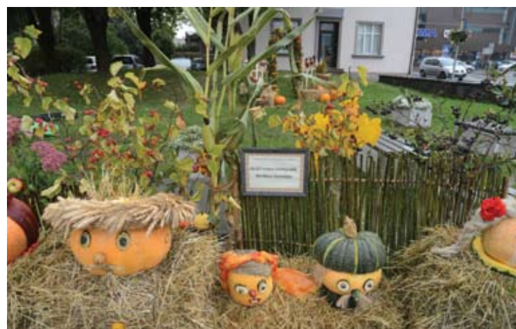
Lopšelio-darželio „Žiogelis“ mažieji taip pat pasistengė išpeities.