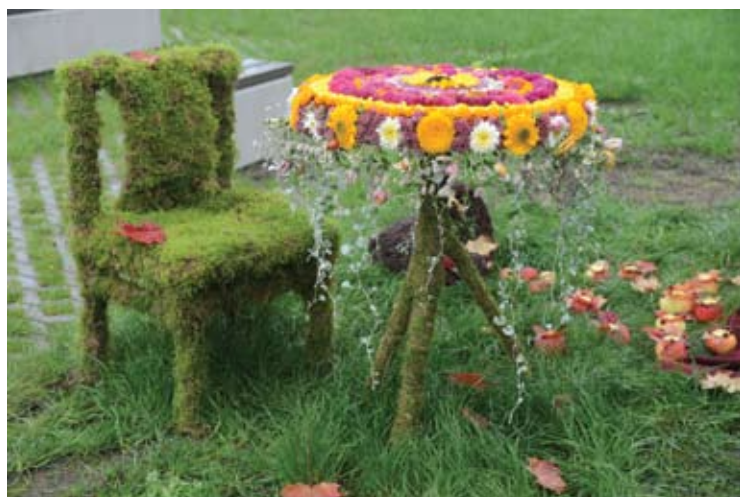
Antano Vienuolio progimnazijos mokiniai paruošė išpūdingą kompoziciją.