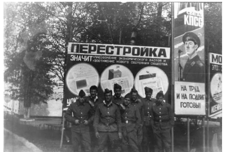
Šioje nuotraukoje Aluksnėje tarnavę lietuviai... Kurių galų fotografuotasi prie stendo su užrašu „Perestrojka“ („Persitvarkymas“) teksto autorius nebeprisimena. Gal toks stendas kareiviams atrodė patriotišku?