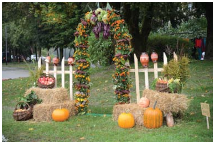
Jono Biliūno gimnazistų darbas.

Praėjusį savaitgalį Anykščiuose vykusio derliaus šventės „Obuolienės“ anykštėnus ir miesto svečius kvietė ne tik paragauti obuolių pyrago ar kompoto, bet ir pasigrožėti tikrų tikriausiais meno darbais iš daržovių – prieš Kultūros centrą puikavosi miesto ugdymo įstaigų kurtos floristinės kompozicijos iš rudens gėrybių.