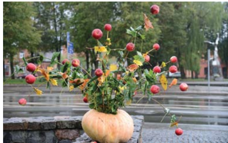
Lopšelio-darželio „Spindulėlis“ auklėtinių darbelis.