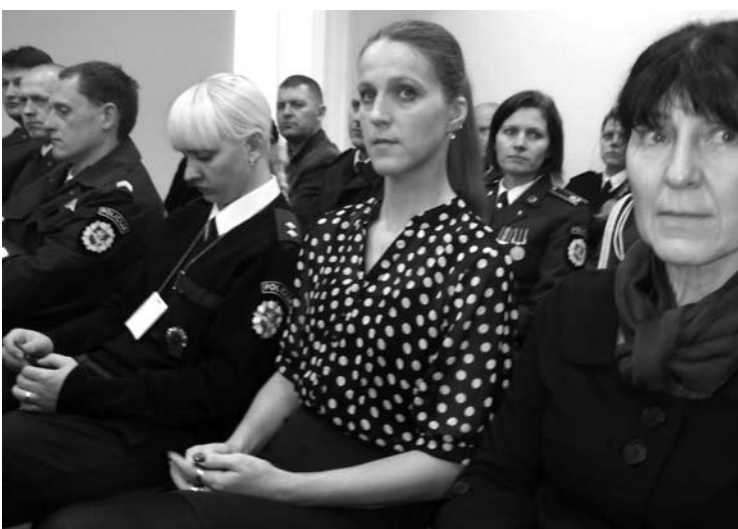
Anykščių policijos komisariate dirba daug moterų.