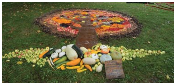
Antano Baranausko pagrindinės mokyklos moksleivių sukurta kompozicija.