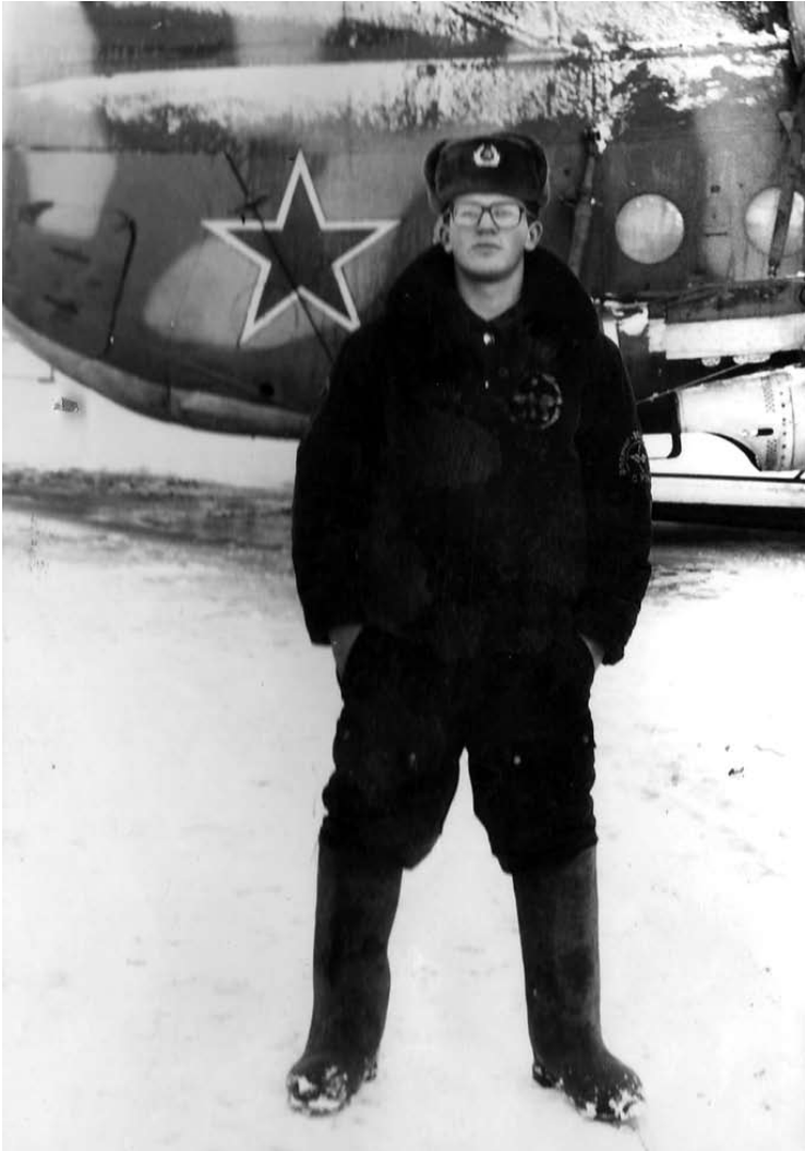
Matyt, jaučiausi kietas...

Vidmantas ŠMIGELSKAS vidmantas.s@anyksta.lt